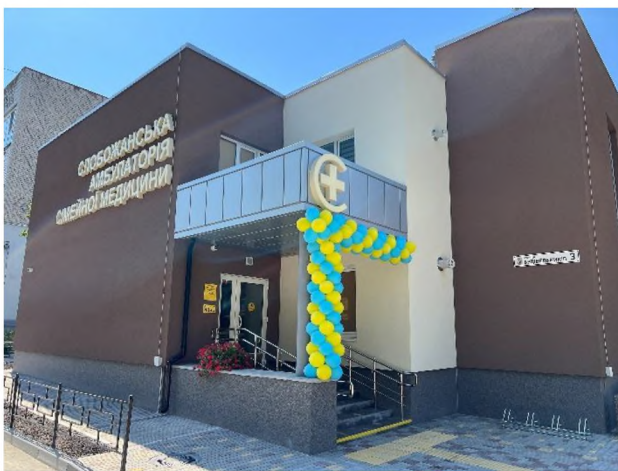
Українським фондом соціальних інвестицій.

Поступово Центром розширюється перелік медичних послуг, що надаються жителям громади. Зокрема, послуг денного стаціонару, виїзду лікаря у не обов'язкових випадках за бажанням пацієнту, проведення окремих маніпуляційних процедур, проведення різних тестів та інші.